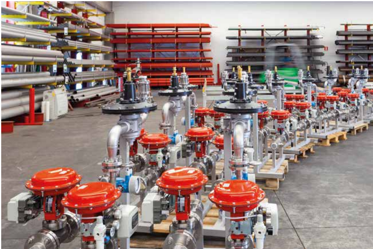
Skid inertizzazione serbatoi