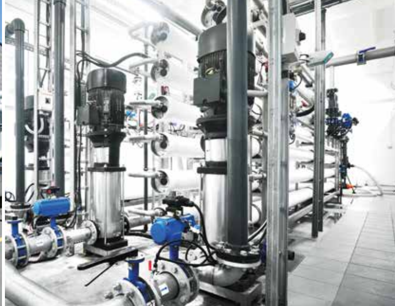
Skid in acciaio inox per impianto chimico di processo